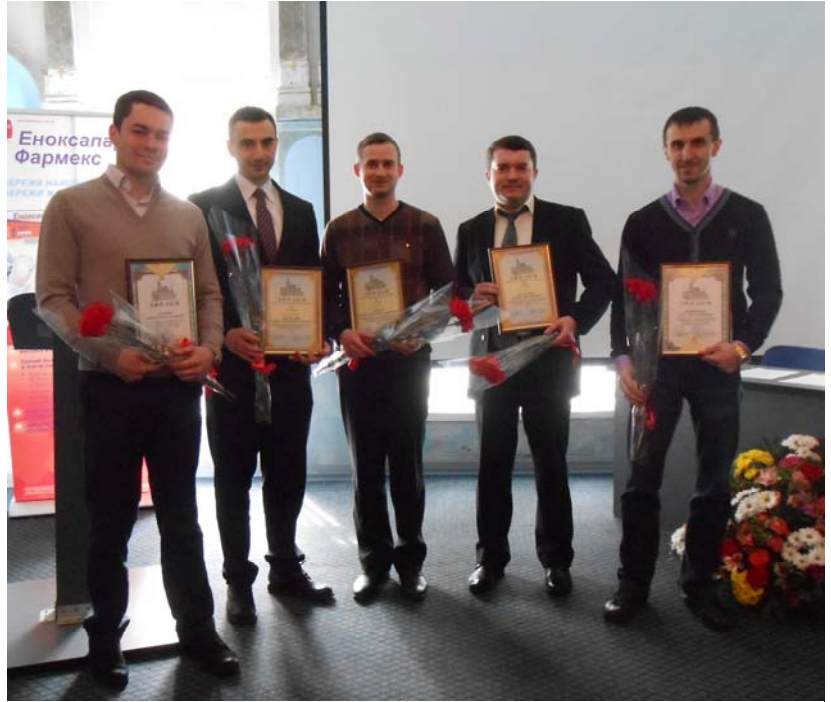
Фото 3. Переможці та учасники конкурсу для молодих вчених на присудження премії ім. проф. М.І. Ситенка за кращі наукові роботи у галузі травматології і ортопедії

Із заключним словом виступив проф. В.А. Філіпенко. Він зазначив, що, продовжуючи традиції, створені попередніми поколіннями харківських ортопедів-травматологів, Харківський обласний осередок ВГО «Українська асоціація ортопедів-травматологів» докладає максимум зусиль для вирішення сучасних актуальних проблем, зміцнення кадрового і наукового потенціалу ортопедії і травматології, виховання нових вчених ортопедів-травматологів.