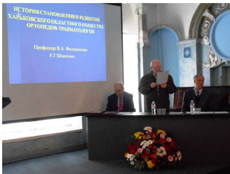
Фото 1. Відкриття конференції, присвяченої 90-річчю ХООВГО «УАОТ»